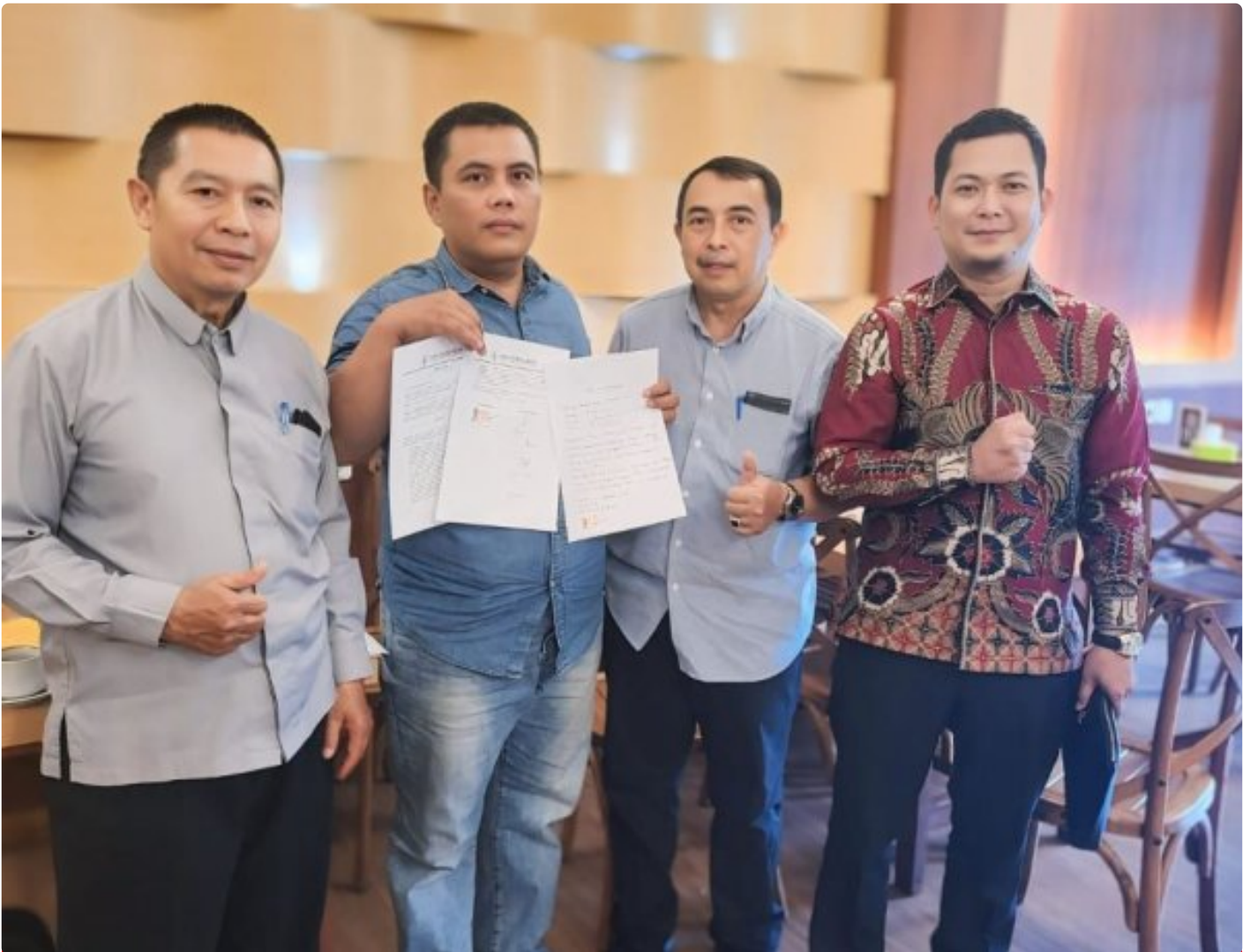
Kuasa Hukum Ningto Wahyu Dens & Partners Lawfirm di perkara Dugaan Pemalsuan Data dan Kredit Fiktif di Bank BRI Unit Kalideres.

JAKARTA, JNI - Seorang bekas nasabah Bank BRI, yang dikenal dengan inisial NW, melaporkan dugaan pemalsuan data dan kredit fiktif yang melibatkan oknum pegawai Bank BRI Unit Kalideres.